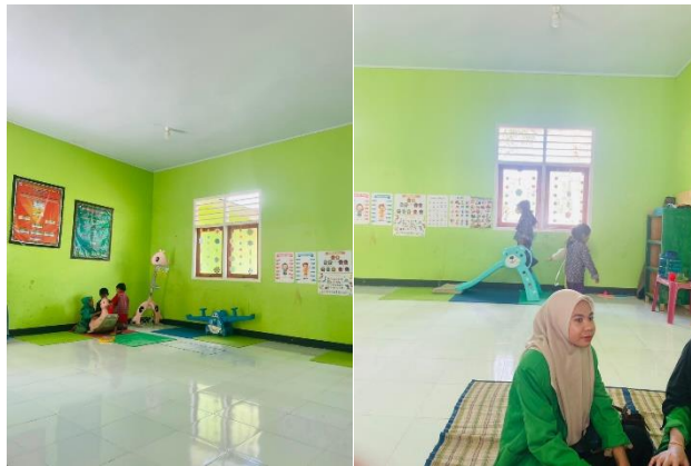
Gambar 3. Anak-anak kelompok B bermain di sentra balok sambil diamati guru untuk pengisian lembar ceklis.

Hasil observasi juga menunjukkan bahwa guru sangat memahami setiap anak memiliki keunikan tersendiri. Anak-anak yang lebih aktif cenderung lebih cepat mencapai indikator perkembangan motorik dan sosial-emosional, sementara anak yang pendiam lebih unggul dalam aspek kognitif dan bahasa. Guru menggunakan hasil penilaian ini untuk memberikan stimulasi tambahan bagi anak yang masih dalam tahap mulai berkembang.