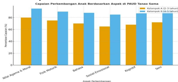
Gambar 4. Grafik Pencapaian

Rekapitulasi hasil penilaian menunjukkan bahwa capaian perkembangan anak pada kelompok B (usia 4–5 tahun) lebih tinggi dibandingkan kelompok A (usia 2–3 tahun). Hal ini wajar karena anak kelompok B sudah memiliki pengalaman belajar yang lebih lama dan kematangan kognitif yang lebih baik. Berikut ringkasan data capaian rata-rata: