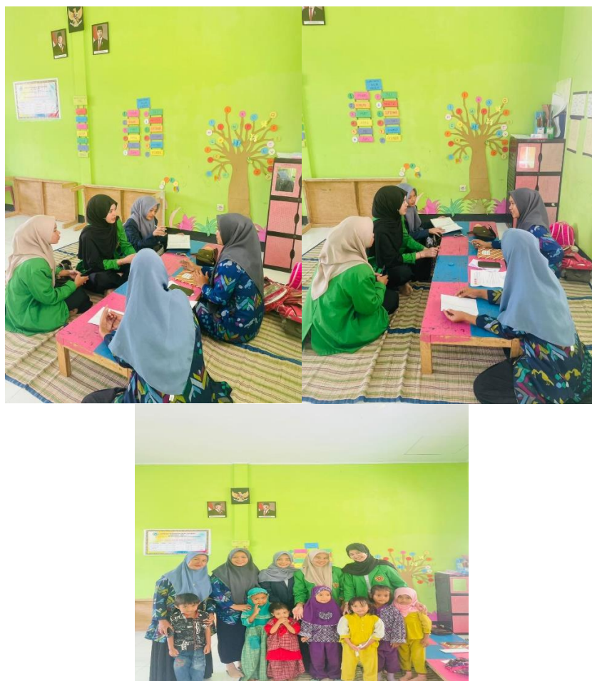
Gambar 5. eneliti melakukan wawancara dengan guru PAUD Tanao Sama terkait pelaksanaan penilaian ceklis perkembangan anak.

Berdasarkan wawancara, guru menilai bahwa sistem penilaian ceklis mempermudah pelaporan hasil perkembangan anak kepada orang tua. Setiap akhir semester, orang tua menerima laporan perkembangan anak yang dilengkapi tanda ceklis dan komentar singkat dari guru. Hal ini menciptakan komunikasi yang efektif antara guru dan orang tua.