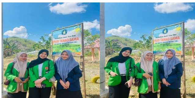
Gambar 2. Lingkungan belajar di PAUD Tanao Sama, Kelurahan Oi Fo'o, Kecamatan Rasanae Timur, Kota Bima

(Permendikbudristek Nomor 5 Tahun 2022). Penilaian dilakukan setiap hari melalui pengamatan selama kegiatan bermain, kemudian hasilnya direkap mingguan dan dilaporkan setiap akhir semester.